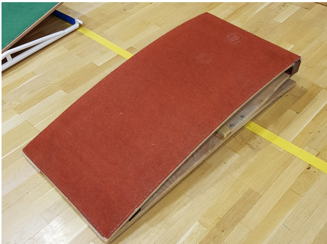
SATSBRÄDA STRATUM Grå